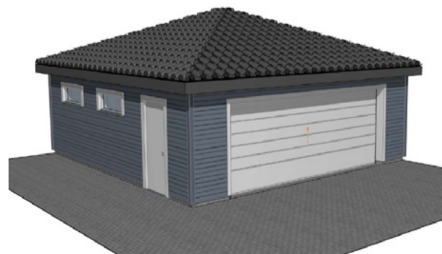
G0019 60m 2