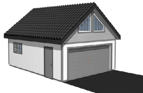
G0005 48m 2 +loft