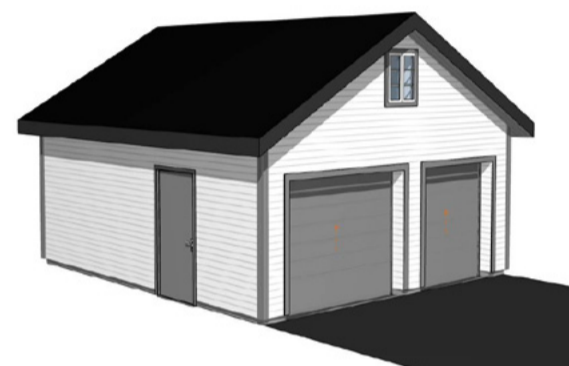
G0007 37m 2 +loft