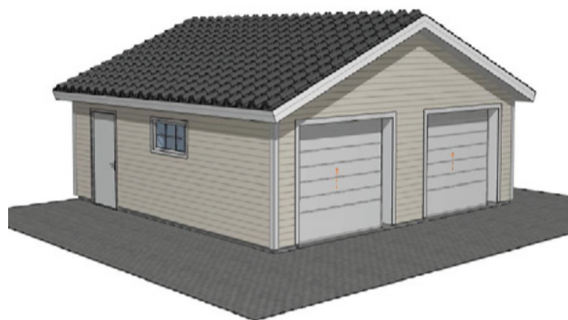
G0006 49m 2