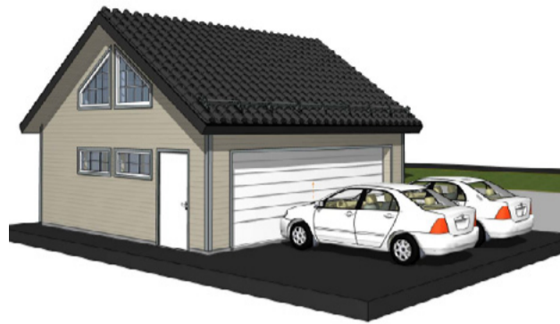
G0004 48,3m 2 +loft