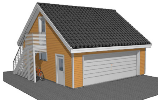
G0014 56m 2 +loft