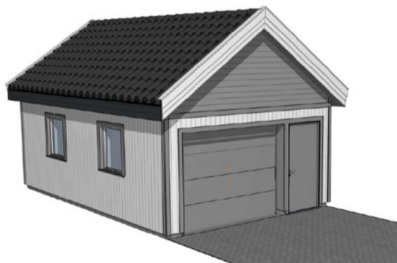
G0009 31,5m 2